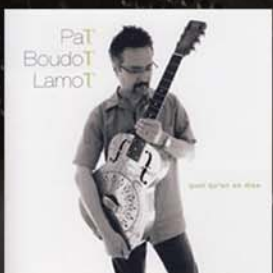
Quoi qu'on en dise 2004