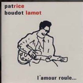
L'amour roule 2001